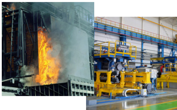
マグニトゴルスク冶金コンビナート

主要企業: マグニトゴルスク冶金コンビナート(MMK)、チェリヤビンスクパイプ圧延工場、ウラル自動車工場、チェリヤビンスク・トラクター工場等、多数。